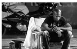
TABOES IN DE SECTOR